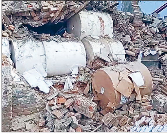
कार्य में लगे रहे। घायलों को इलाज अस्पताल में भर्ती कराया गया है, जहां उनका उपचार चल रहा है।

दिल्ली देहात के सिरसपुर इलाके में एक गोदाम की दीवार गिरने से एक मजदूर की मौत हो गई वहीं चार लोग घायल बताए गए हैं। जानकारी के अनुसार यह हादसा गुरुवार को सिरसपुर की गली नंबर चार में दोपहर करीब एक बजे हुआ। जिस गोदाम की दीवार गिरी, उसके बगल में मजदूर नींव की खोदाई कर रहे थे। इसी दौरान दीवार मजदूरों पर गिर गई। घटना की सूचना मिलते ही पुलिस और दमकल सेवा विभाग की टीम ने राहत कार्य शुरू किया। वहीं, दिल्ली नगर निगम प्रशासन ने बताया कि उनके कर्मचारी भी राहत