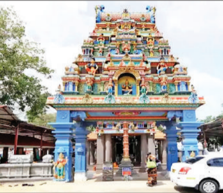
मोडीकुंड भगवती मंदिर तमिलनाडु के कन्याकुमारी के टट पर कोलावेल के पास स्थित मंदिर है। यह मंदिर माता भगवती की सुकंद मूर्ति के आकर्षण के कारण लोकप्रिय बन गया है।